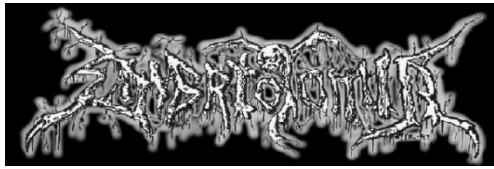
EMBRIOTOMIA ZINE Diciembre 2009

Una vez más! Esta es la tercera entrega y vamos para adelante. Agradezco a las personas que se han puesto en contacto con el fin de que su material sea reseñado, pero debo recalcar que solamente se reseña material original y no descargado. Gracias, pero es mejor seguir en esta línea con el fin de apoyar a bandas y a compañías.